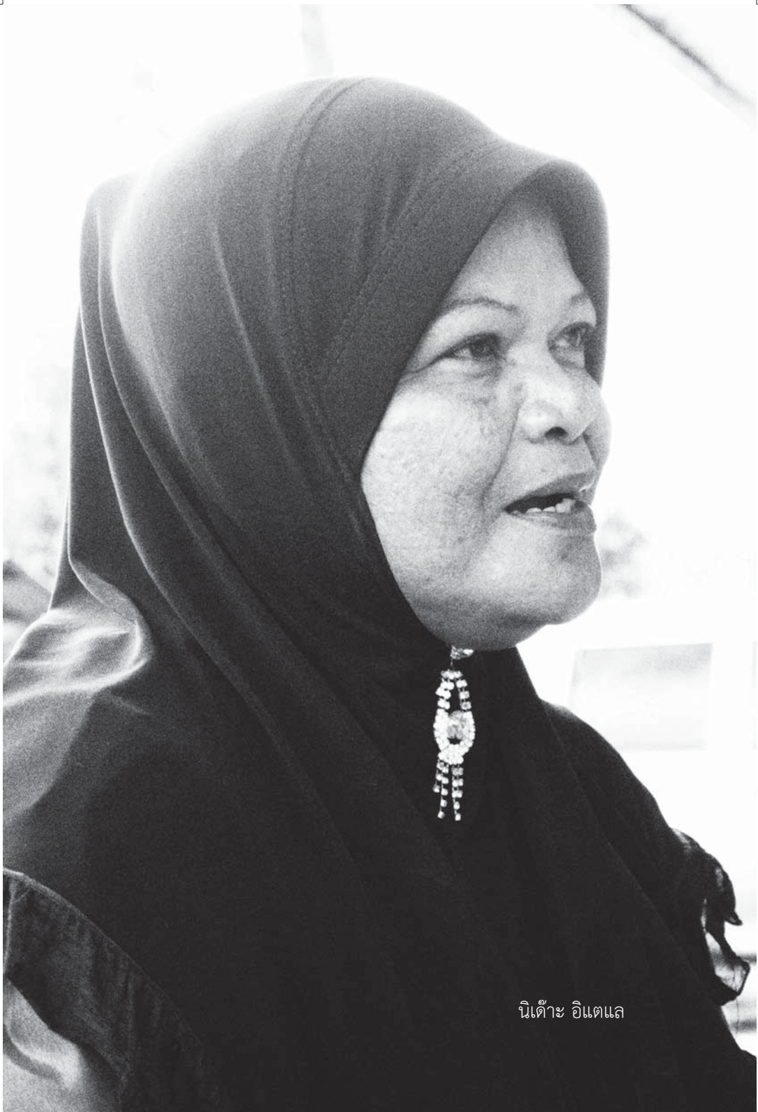
นิต้าะ อิตถถ