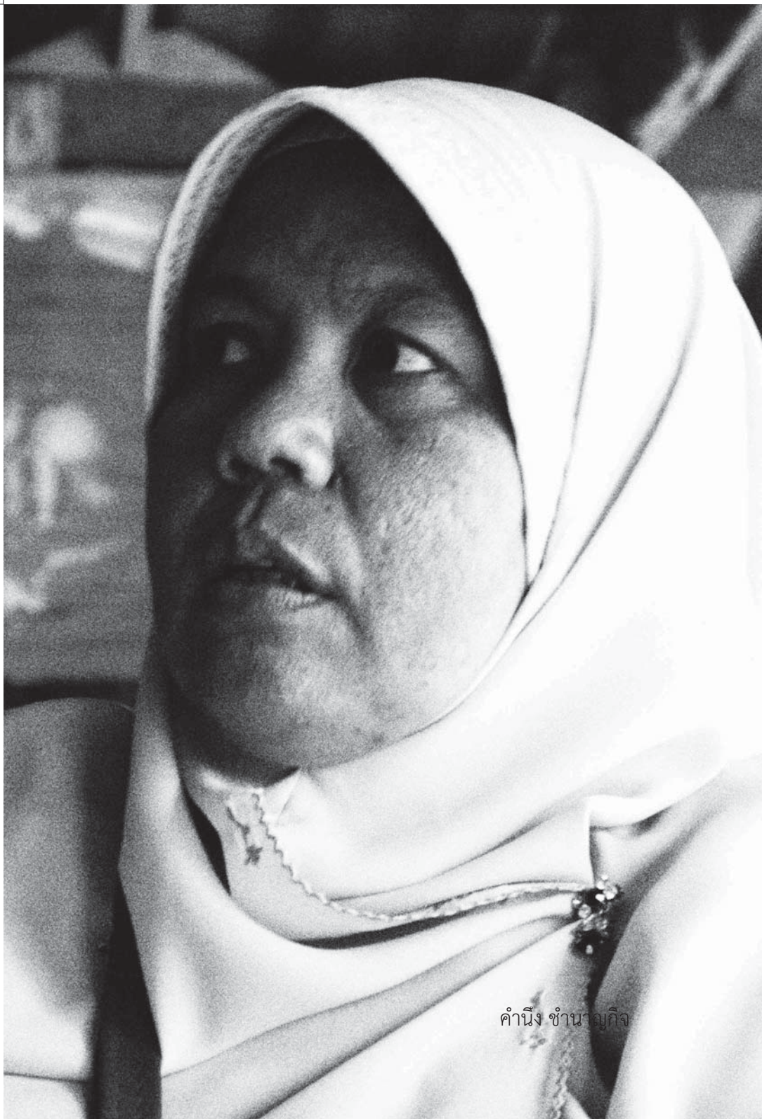
คำนึ่ง ชำนาญกิจ