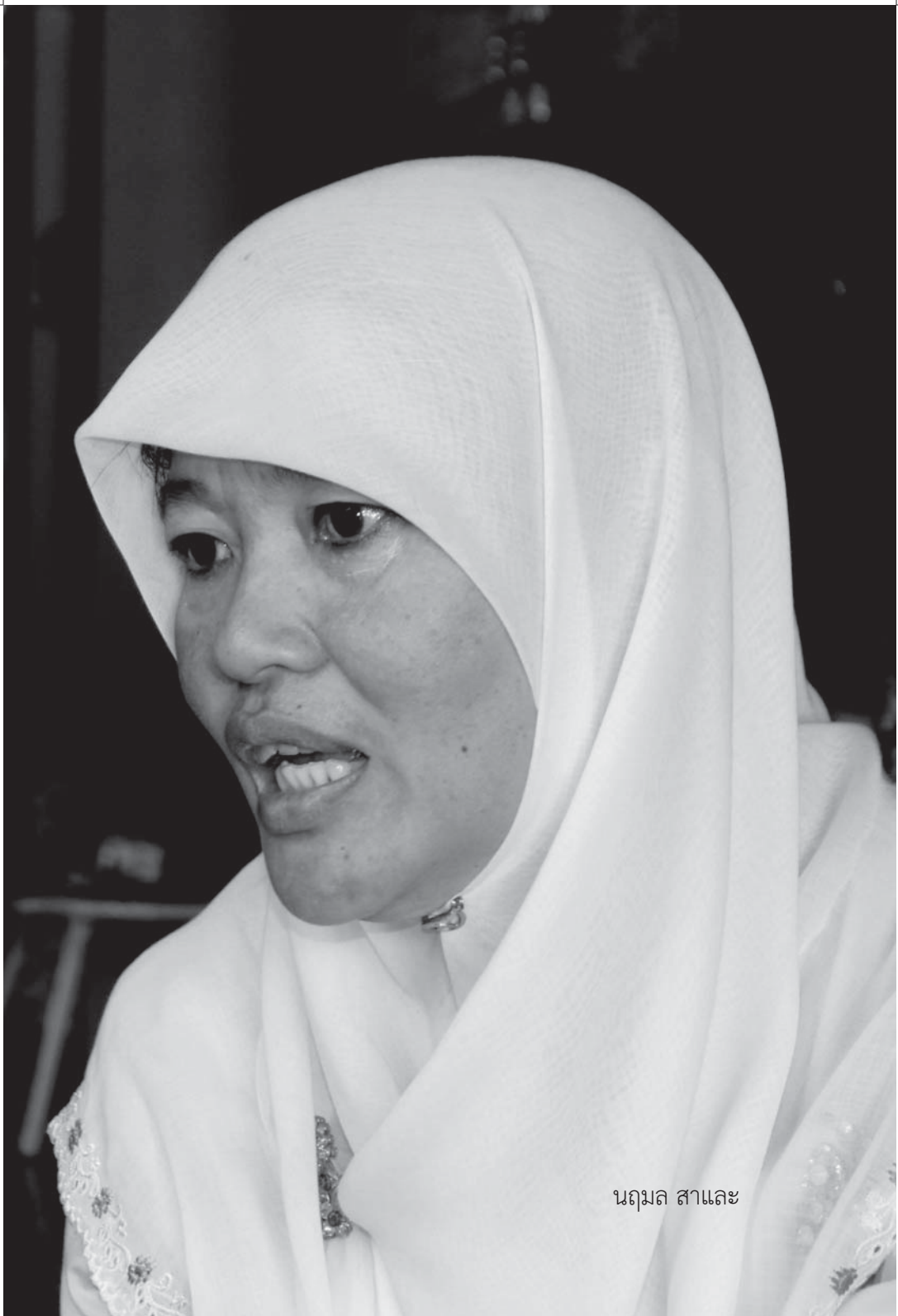
นฤมล สากลและ