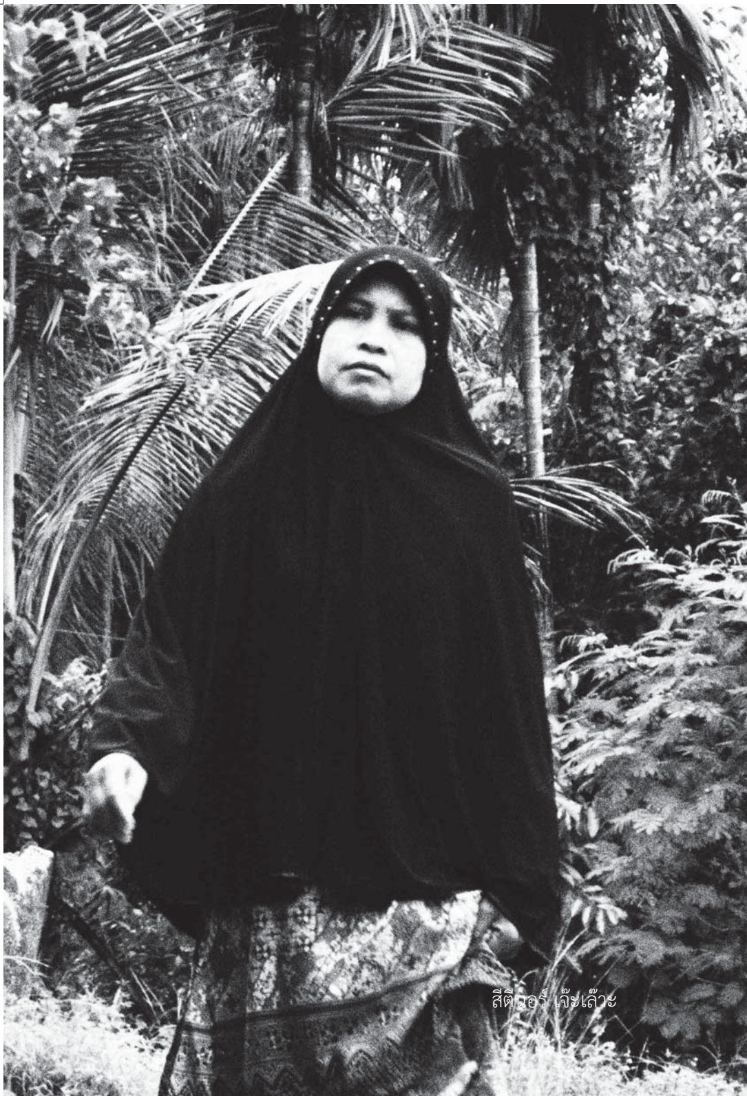
ສິຕິໄນອຽ ເຈິ້ງເຄີ້ວະ