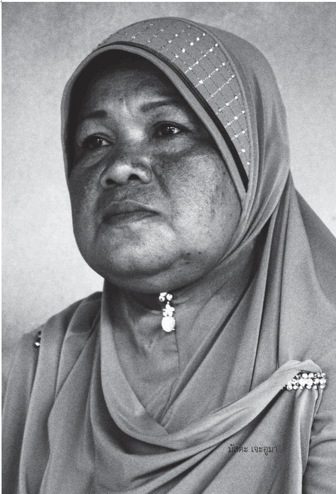
ມ້ສຕະ ເຈະອູມາ